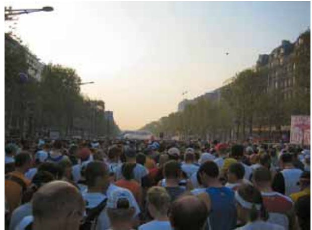
..., listos, ...