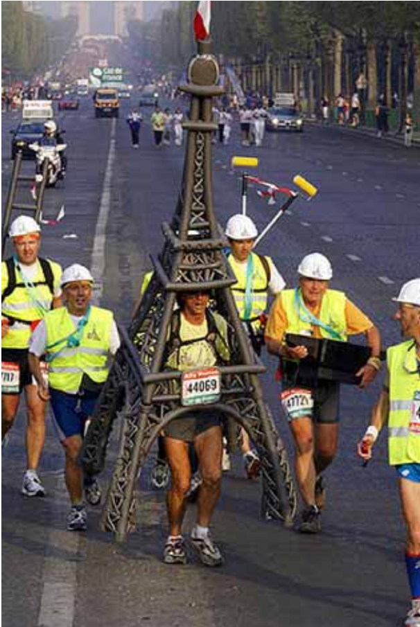
Esto también tiene mérito