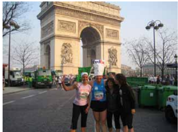
La alianza de las civilizaciones